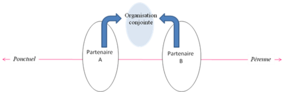
Figure 2. Le modèle des compétences mutualisées

L'établissement d'une co-entreprise engendre de nombreux défis pour la gestion des compétences. Au niveau individuel, on retrouve bien sûr la nécessité pour chaque partenaire de mettre à disposition les compétences adaptées aux objectifs du partenariat, tout en assurant la protection de chacun dans un contexte de coopération (Luo, 2007), et en rendant possible l'éventuel retour de chacun dans sa société d'origine en cas de rupture de la collaboration. Au niveau collectif, l'enjeu est de permettre le fonctionnement effectif de nouvelles équipes mixant les expertises issues des deux sociétés. À un niveau plus stratégique, le défi de telles joint-ventures est de constituer une véritable compétence stratégique nouvelle en mettant en synergie les capacités des deux partenaires et non en les faisant se succéder le long d'une chaîne d'approvisionnement. Quant au niveau inter-organisationnel, il est dans ce cas de figure en quelque sorte